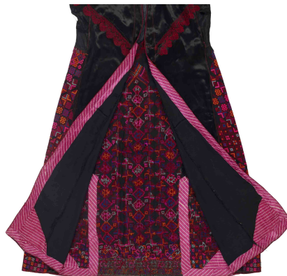
Manteaux de femmes syriennes