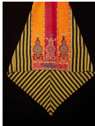
Manche brodée d'une robe de femme palestinienne