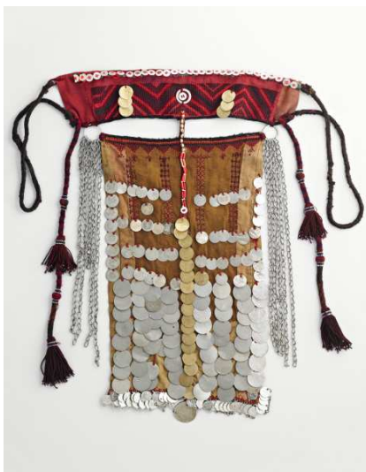
Voile de visage de bédouine

Dans ce même espace, une série de petites robes brodées, réalisées spécialement pour l'exposition, offre aux visiteurs en situation de handicap visuel la possibilité de « lire avec les doigts » les tissus à la découverte des coupes et des broderies des pièces exposées.