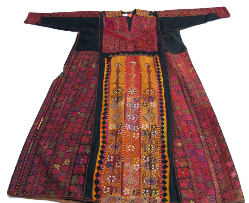
Robe de fête d'une femme palestinienne