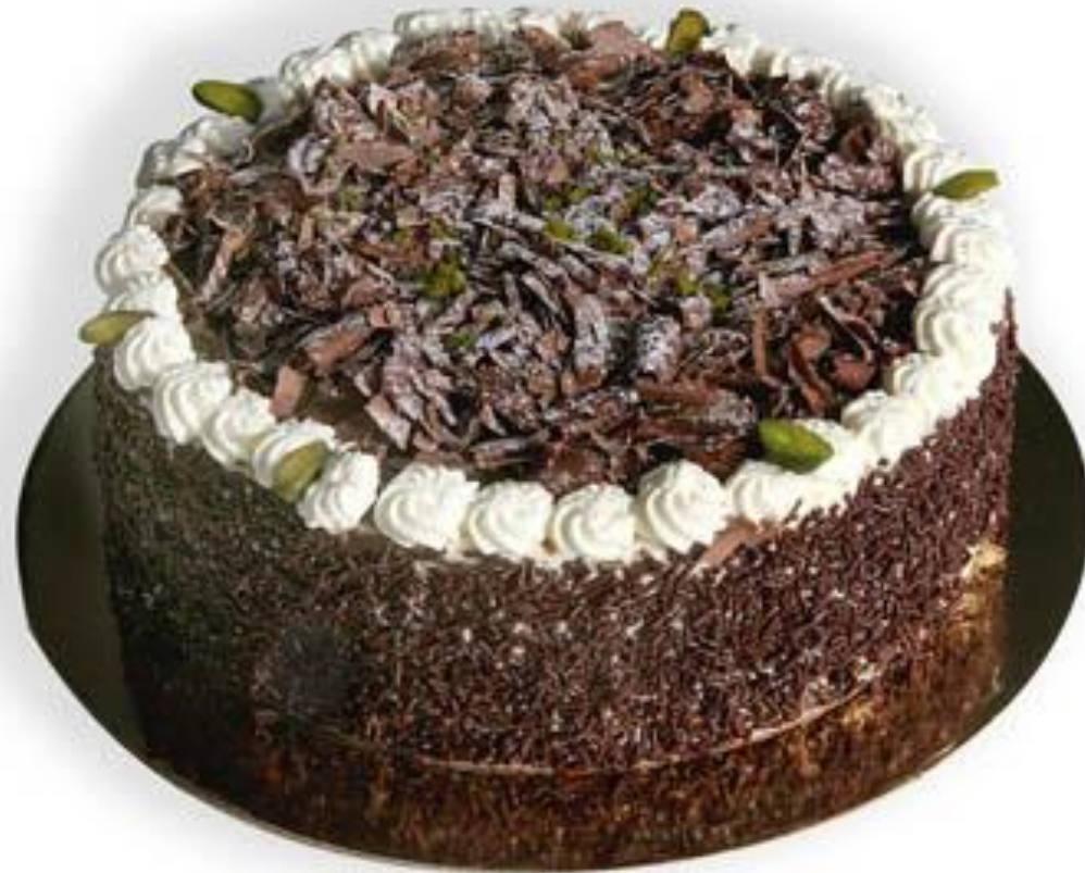
Une forêt noire