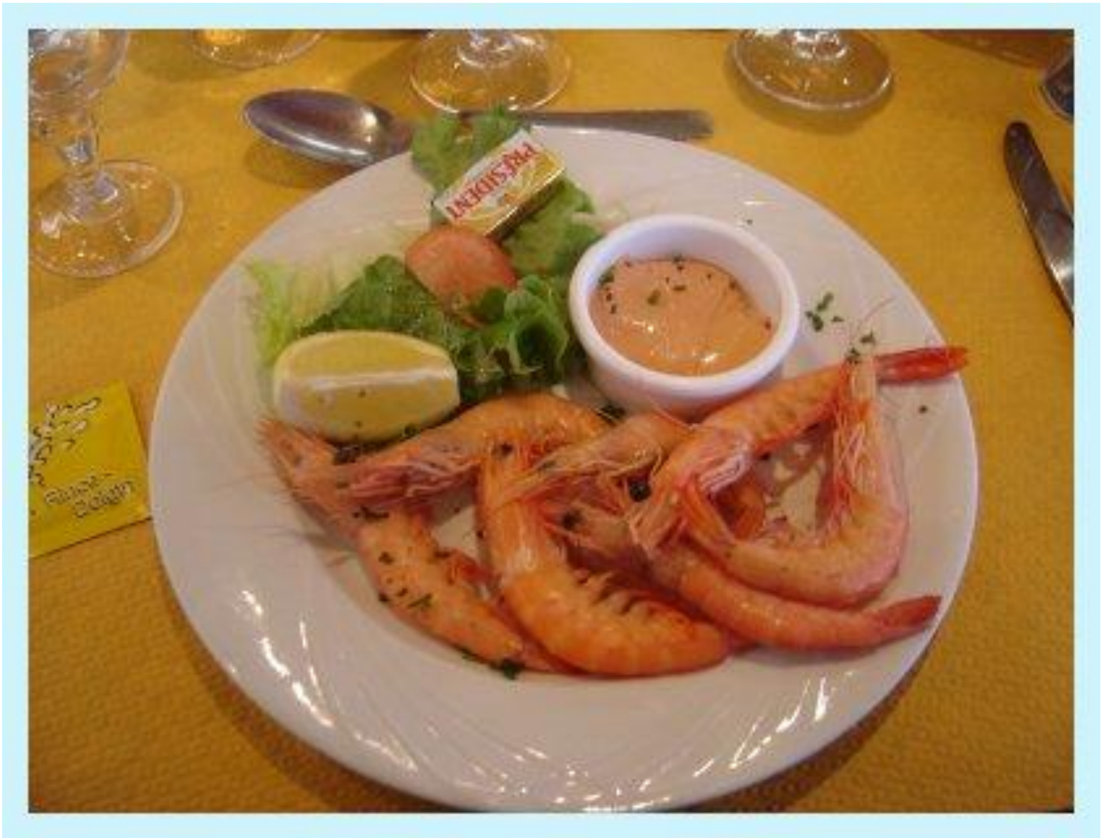
Plat de crevettes d'alaska!!