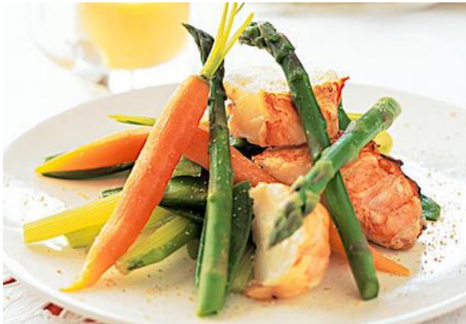
. Salade de langouste,