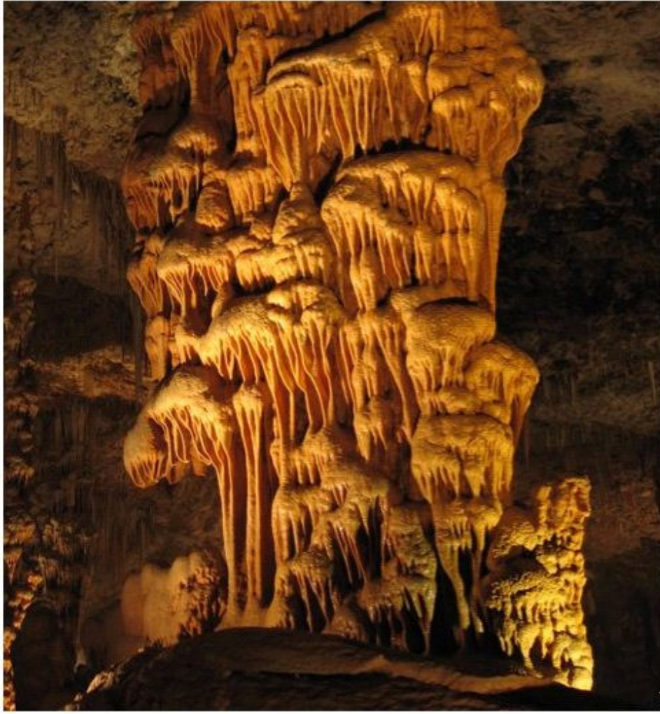
عين السمك -5