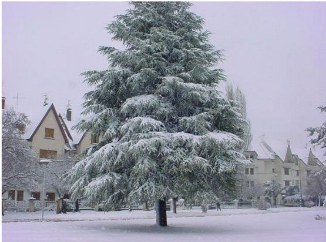
أوریکا - 10