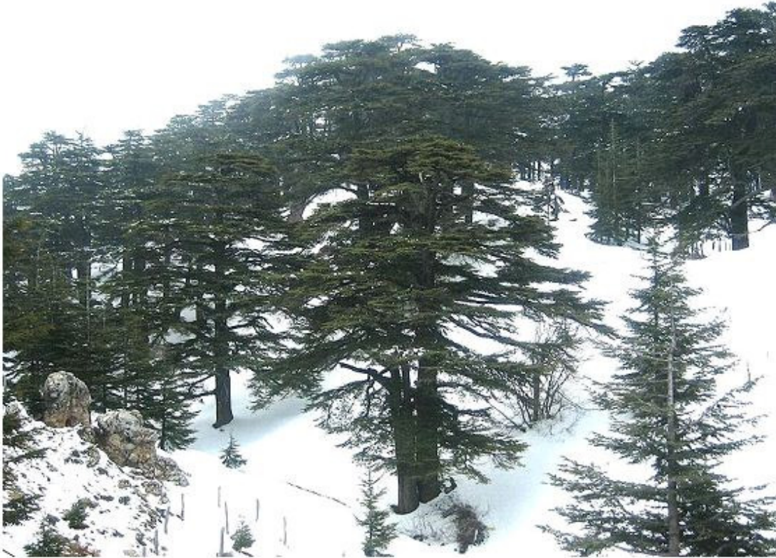
:غابات الأرز الذي يغطيها جليد الشتاء في وادي قاديشا